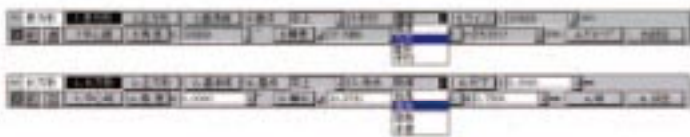
BCAD-DUO(日中)的绘图功能概要请参考资料CADPAC-CREATOR 2D。 BCAD-DUO是日中特别版，并且与现在发售的CADPAC-CREATOR 2D兼容。

BCAD-DUO的中日版其实是同一个程序。只是菜单、提示信息等部分依据各国语言分别安装。无论是功能还是操作性都是完全相同的。